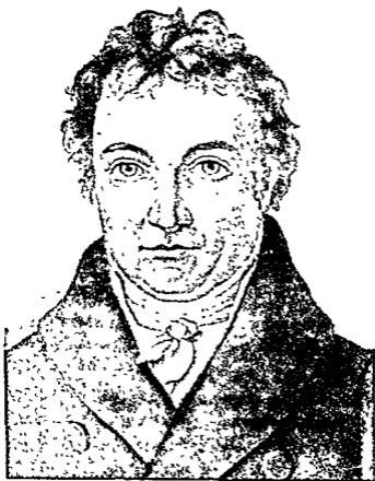
जोहान गॉत्तलिब फिच्ने